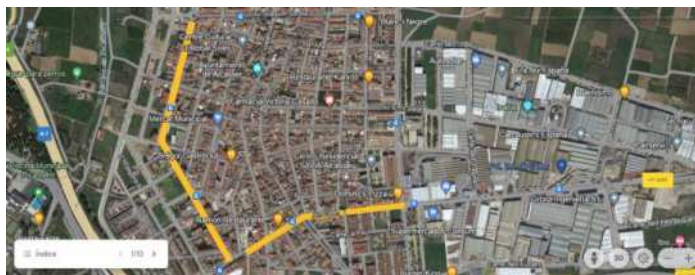
CASCO URBANO DE ALCÀSSER