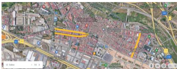
CASCO URBANO DE QUART DE POBLET