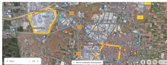
CASCO URBANO DE ALDAIA