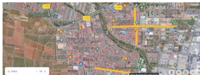
CASCO URBANO DE PAIPORTA