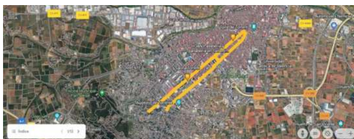
CASCO URBANO DE TORRENT