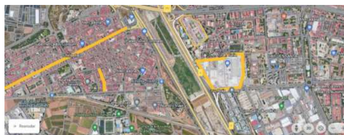
CASCO URBANO DE XIRIVELLA