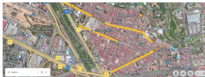
CASCO URBANO DE MISLATA