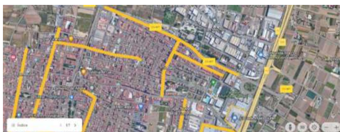
CASCO URBANO DE SEDAVI