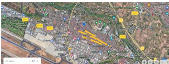
CASCO URBANO DE MANISES