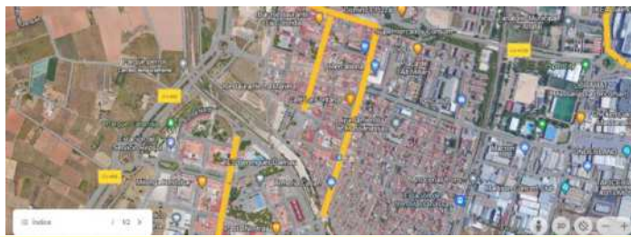
CASCO URBANO DE MASSANASSA