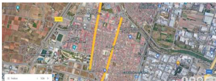
CASCO URBANO DE CATARROJA