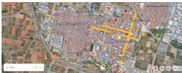
CASCO URBANO DE ALBAL