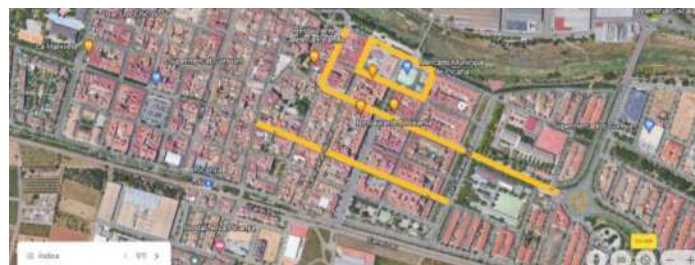
CASCO URBANO DE PICANYA