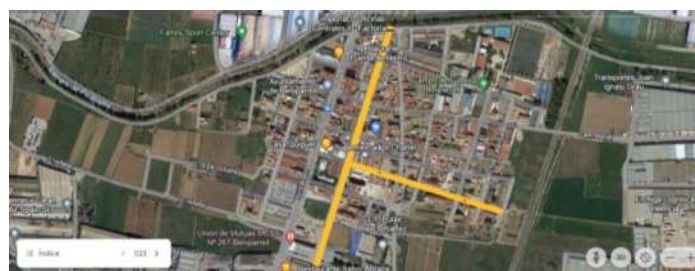
CASCO URBANO DE BENIPARRELL