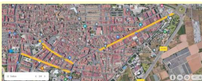
CASCO URBANO DE ALAQUÀS