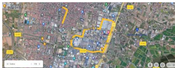
CASCO URBANO DE ALFAFAR