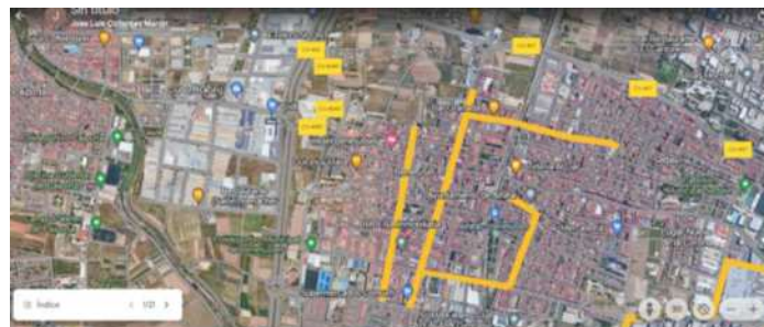
CASCO URBANO DE BENETUSSER