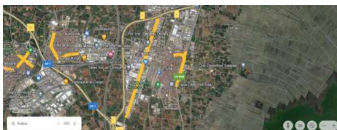
CASCO URBANO DE SILLA