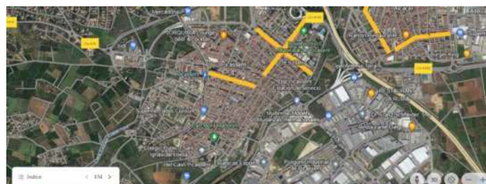
CASCO URBANO DE PICASSENT